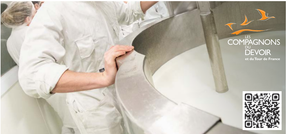
© 10-2020 Compagnons du Devoir - Crédits photos : Thierry Caron / Divergence - Ne pas jeter sur la voie publique.

Le métier de fromager se déroule en entreprise de transformation laitière industrielle ou artisanale. Le fromager intervient sur les étapes de fabrication des fromages frais ou affinés : filtrage, culture des ferments, mise en forme et affinage. Il/elle assure également les analyses et les contrôles du lait tout au long du processus de transformation. Il/elle pilote les opérations de transformation du produit jusqu'à son conditionnement et son expédition, dans le respect des normes d'hygiène et de sécurité alimentaire.